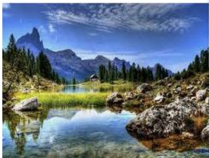
Сочинение на тему: «Природа» natworld.info