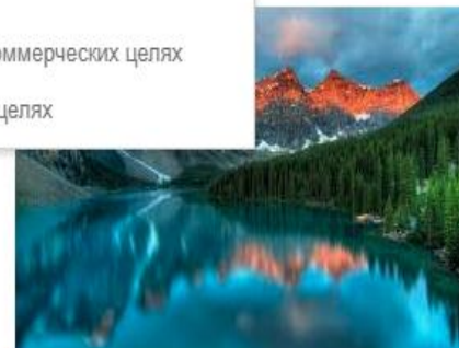
Природа природы. Существует ли любовь? - ... 5sfer.com