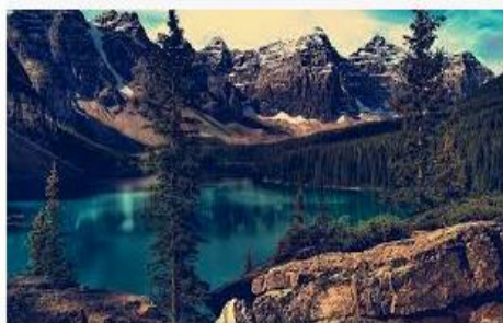
Почему природа такая красивая? thequestion.ru