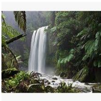
Природа — Википедия ru.wikipedia.org