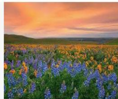
20 мест на планете, где природа не пожалела красок adme.ru