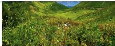
Природа Абхазии. (Abkhazian nature) - YouTube youtube.com